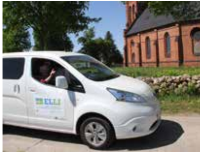
Seite 34 __ Flächenbus ELLI