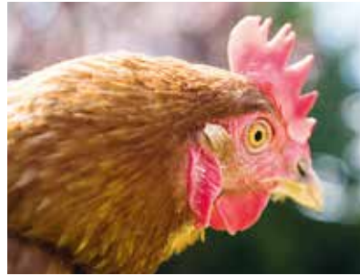
Seite 42 __ Hühner unter Bäumen