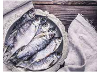
Seite 50 __ Chance für deutsche Fischer