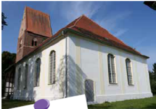
Kirchenschiff im sanierten Zustand.