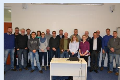
Projektteilnehmer der OG Milch (Stand: Januar 2016)

Eine Kernfrage in der Milchviehhaltung: wie viel kg Trockensubstanz fressen meine Tiere täglich?