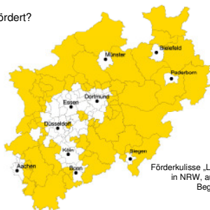
Förderkulisse „Ländlicher Raum“ in NRW, außerhalb nur mit Begründung!