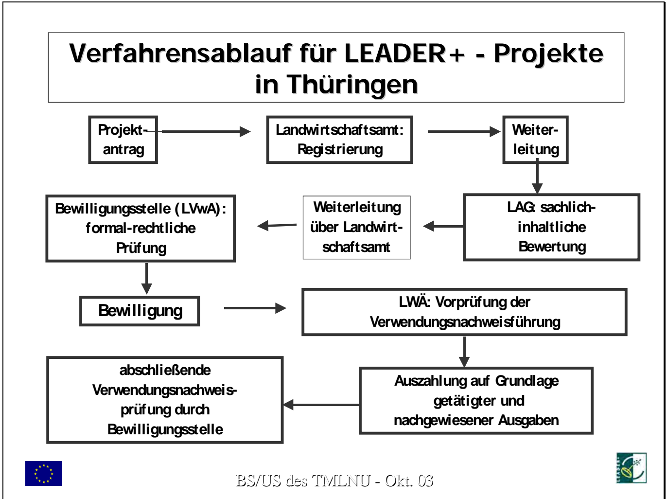
Verfahrensablauf, Abbildung 1